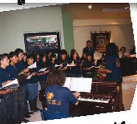
Presentación del coro del Plantel