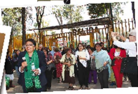
Apertura Simbólica del Plantel