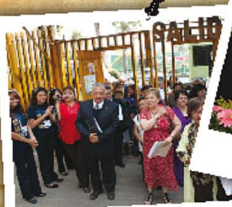
Profesores Ingresando a la Escuela